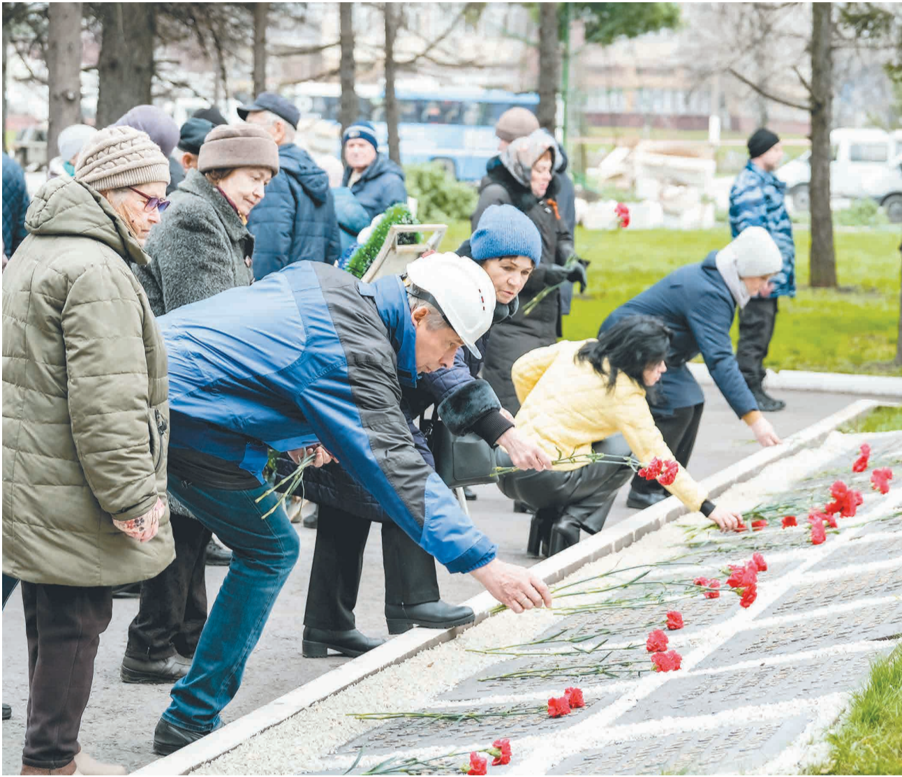
↑ Возложение цветов.

В 84-ю годовщину обороны Тулы сотрудники и ветераны Тулачермета почтили память героев-защитников города