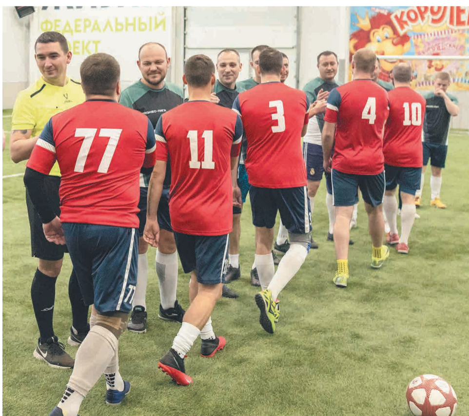
↑ Приветствие перед матчем.

Футболисты Тулачермета соревнуются в «Битве клубов»