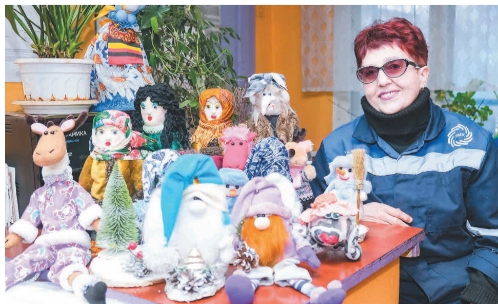
Благодаря нашей героине сказочные персонажи буквально оживают.