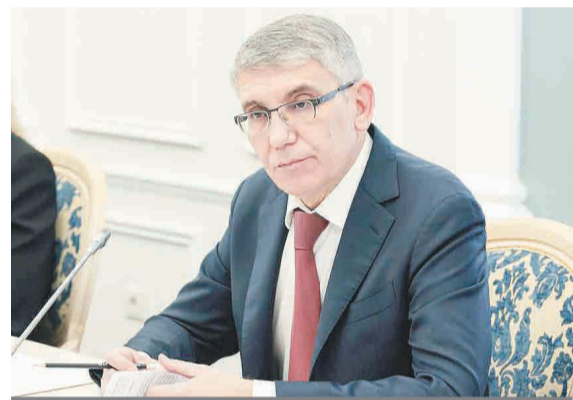
Дмитрий Миляев Губернатор Тульской области.

Г убернатор Дмитрий Миляев провел рабочую встречу с Губернатором Ульяновской области Алексеем Русских.