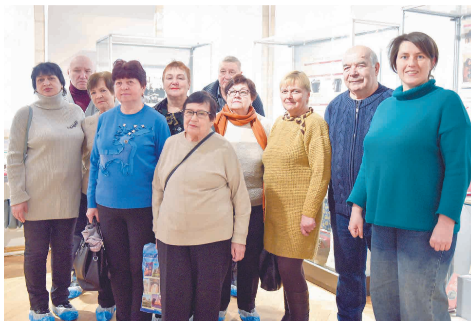
↑ Ветераны получили огромное удовольствие от экскурсии.

Ветераны Тулачермета посетили Тульский краеведческий музей