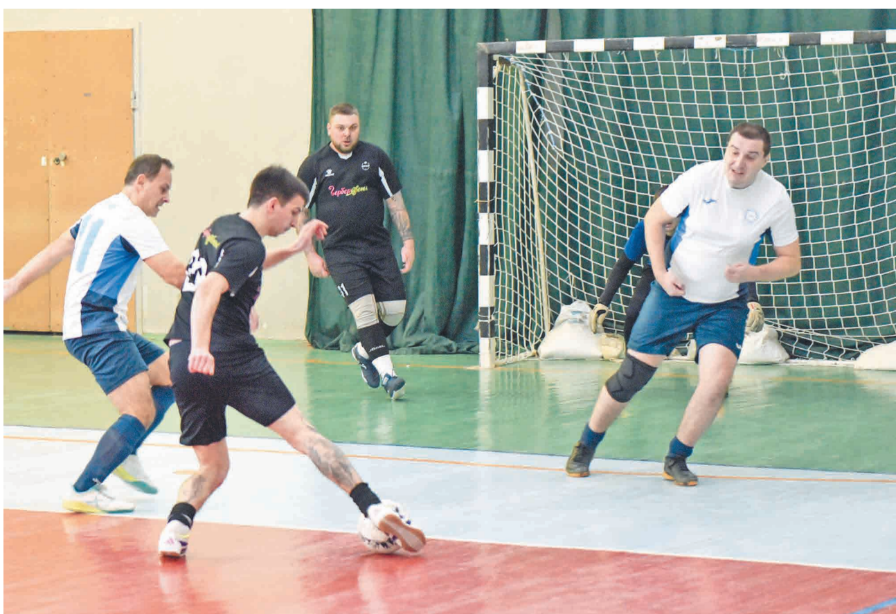
↑ Впереди у нашей команды еще 10 матчей.

Н аша мини-футбольная команда выступает в Первой лиге в группе В. В настоящий момент в турнире сыграно уже 20 туров. За это время металлурги одержали 6 побед, трижды сыграли вничью и 11 раз уступили своим соперникам по турнирной таблице.