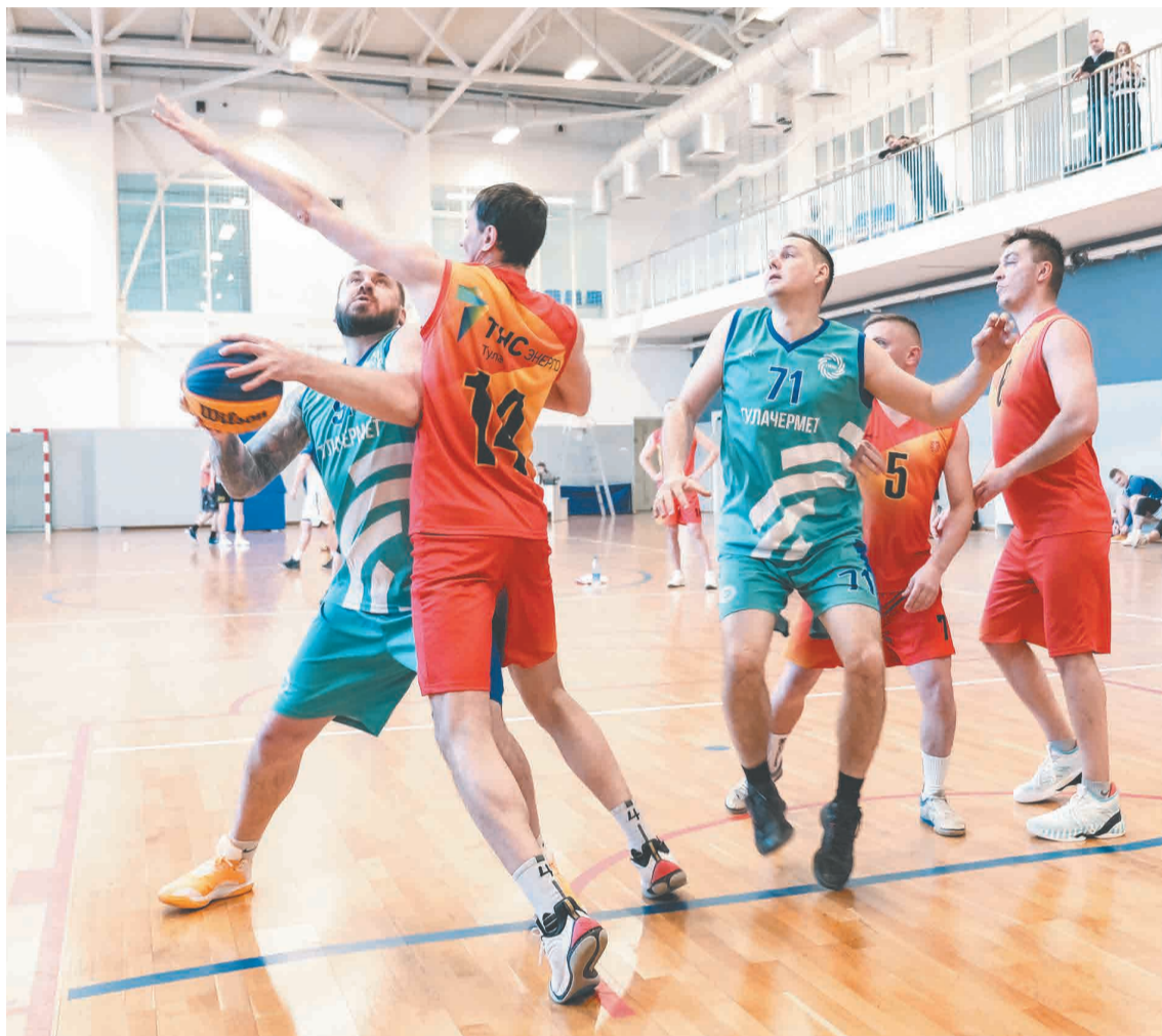
↑ Борьба под корзиной.

В «Битве» принимает участие 71 клуб из разных уголков области. Участники клубов представляют техникумы, колледжи, вузы, а также спортивные сообщества, созданные в организациях и на предприятиях региона.