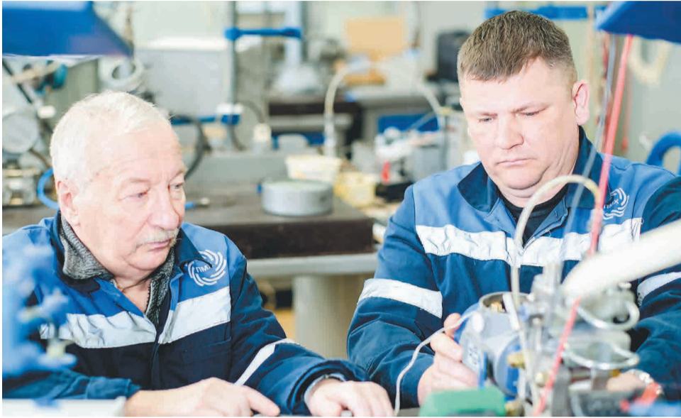
↑ Все работники ЦЛА — специалисты широкого профиля.

История лаборатории началась в 1951 году, когда на НТМЗ сформировалось первое специализированное подразделение — цех КИПиА. Спустя некоторое время была введена в эксплуатацию новая доменная печь, развиты технологии порошковой металлургии и запущен блок разделения воздуха. Эти передовые направления нуждались в улучшенном контроле техноло-